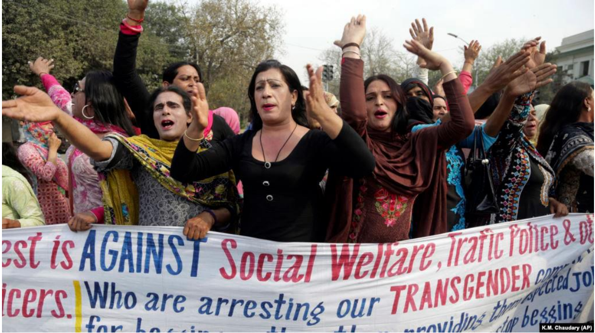
شکیلین آچیخلاماسی: ۲۰۱۸ جی ایلین مارت آییندا اعتیرازچی لار، ترنسجندر علیه ینه زوراکیلیغا قارشى و ترنسجندرلرین مودافیعه قانون لارینی دستکله مک اوچون لاهوردا کوچه لره چیخیب لار.

گوله لنه رک اؤلدورولدو و بوندان سونرا بو مرکزین رهبرلیگی «ماروی ماهزار» طرفیندن عهده لندی. ماهزار بو فستیوال حاققیندا دئییر: «دوشونورم کی، بو ترنسجندر ایزله بیجی لرینین موختلیف ایزله بیجی لرله بیرلیکده بیر آرایا گلرک بیرلیکده گؤزل واخت کئچیردیکلری ایلک پروقرامدی.»